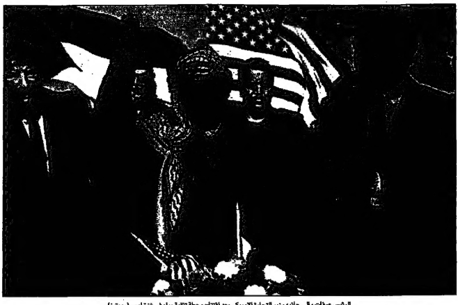
الرئيس عرفات في جانب وزير الخارجية المصري بعد افتتاح محطة توليد مياه في غزة (ديارنا)

وقال الرئيس الوزراء الإسرائيلي بنيامين نتنياهو أمس الثلاثاء إن السلطة الفلسطينية ستعود إلى الكفاح المسلح إذا لم تتراجع عرفات عن تحذيراته بالعودة إلى الكفاح المسلح. وأضاف نتنياهو في مقابلة مع شبكة تلفزيون إسرائيلي أن السلطة الفلسطينية ستعود إلى الكفاح المسلح إذا لم تتراجع عرفات عن تحذيراته بالعودة إلى الكفاح المسلح. وأضاف نتنياهو في مقابلة مع شبكة تلفزيون إسرائيلي أن السلطة الفلسطينية ستعود إلى الكفاح المسلح إذا لم تتراجع عرفات عن تحذيراته بالعودة إلى الكفاح المسلح. وقال نتنياهو في مقابلة مع شبكة تلفزيون إسرائيلي أن السلطة الفلسطينية ستعود إلى الكفاح المسلح إذا لم تتراجع عرفات عن تحذيراته بالعودة إلى الكفاح المسلح. وأضاف نتنياهو في مقابلة مع شبكة تلفزيون إسرائيلي أن السلطة الفلسطينية ستعود إلى الكفاح المسلح إذا لم تتراجع عرفات عن تحذيراته بالعودة إلى الكفاح المسلح. وقال نتنياهو في مقابلة مع شبكة تلفزيون إسرائيلي أن السلطة الفلسطينية ستعود إلى الكفاح المسلح إذا لم تتراجع عرفات عن تحذيراته بالعودة إلى الكفاح المسلح. وأضاف نتنياهو في مقابلة مع شبكة تلفزيون إسرائيلي أن السلطة الفلسطينية ستعود إلى الكفاح المسلح إذا لم تتراجع عرفات عن تحذيراته بالعودة إلى الكفاح المسلح.